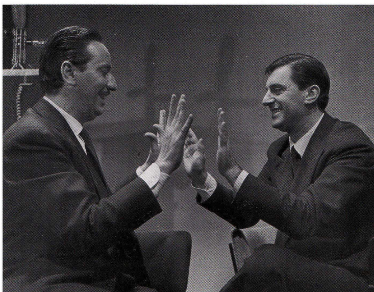
Lelio Luttazzi e Gorni Kramer sul set di Pazzi per la musica .

Le straordinarie biografie di 20 musicisti che hanno fatto la storia del jazz